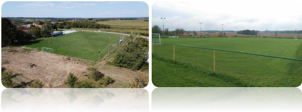
Slika 1: Nogometna igrališta na području Općine Velika Trnovitica